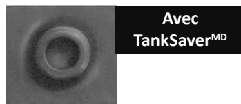
Avec TankSaver MD