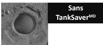
Sans TankSaver MD