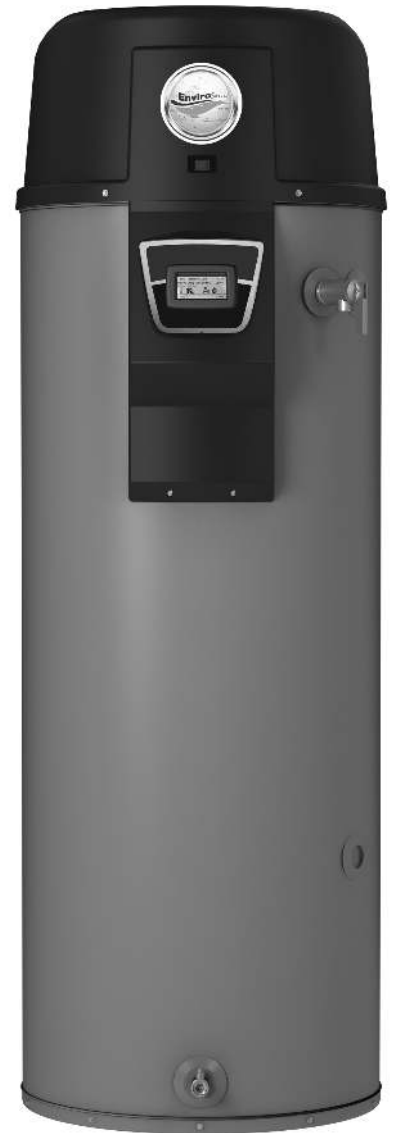
Modèle de 50 USG illustré